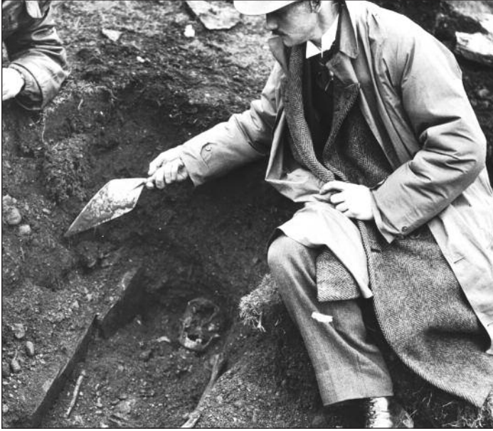
Liam i mbun tochairle ar láthair seandálaíochta déanach sna 1930idí